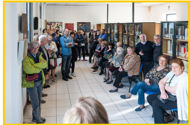
Il numeroso ed attento pubblico presente all'inaugurazione della mostra