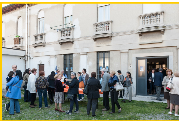
Il rinfresco all'esterno della mostra