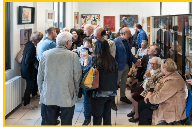
Il numeroso ed attento pubblico presente all'inaugurazione della mostra