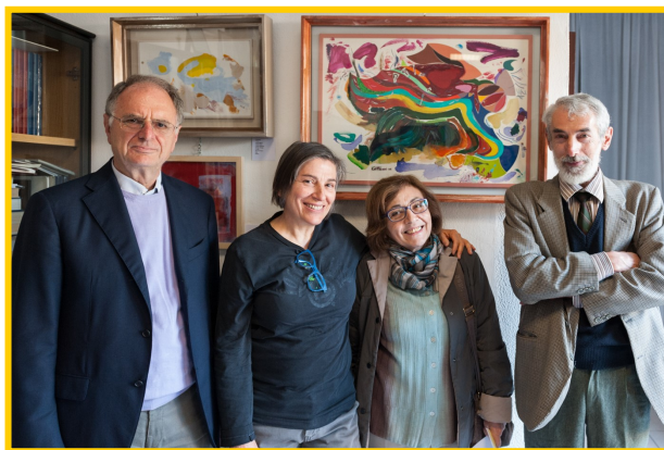
L'artista ed i relatori della manifestazione